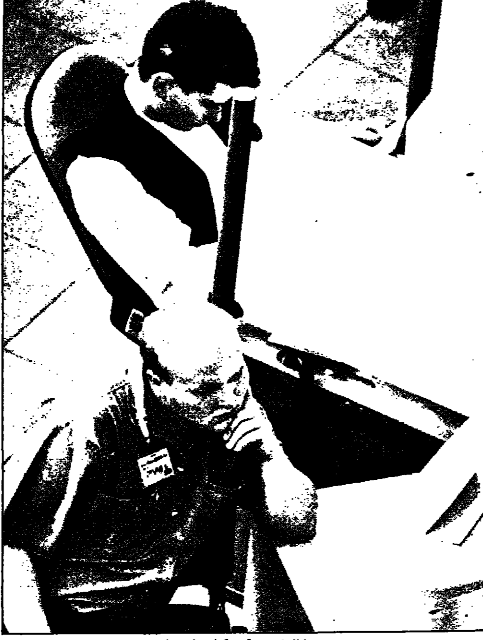
متعلمين في بورصة موسكو أمس

هونغ كونغ - رويترز - قال متعاملون من أسواق الذهب انخفضت في نهاية التعاملات الغربية في سوق هونغ كونغ أسهم الذهب بثلث الإقبال على البيع من جانب متعاملين محترفين ومتجنين استراتيجيين غدت على أثر عمليات شراء لتخفيفه للركاز من اليابان. وبلغ سعر الذهب عند الإغلاق في هونغ كونغ 282.50 دولاراً أمريكياً (لأونصة) مقارنة بـ 282.70 دولاراً أمس وبسعر الإغلاق في نيويورك أسس الأول 285.31 و 285.31 دولار عند الإغلاق السابق في هونغ كونغ.